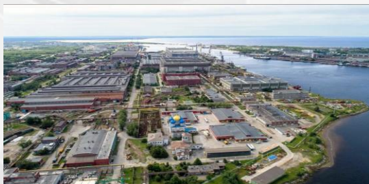
АО «ПО «СЕВМАШ»